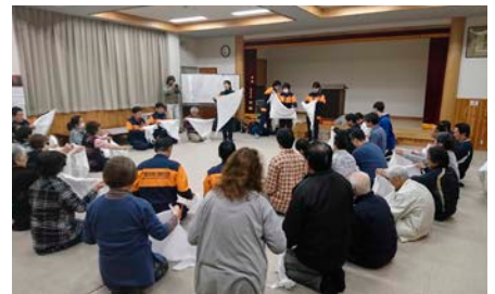
萩倉地区公民館にて応急手当講習会