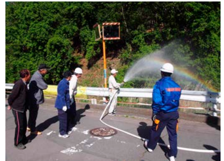
下屋敷消火栓訓練の様子